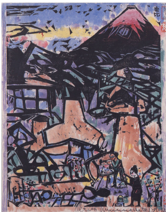
棟方志功「東海道棟方板画 由比 春富嶽の欄」1964年