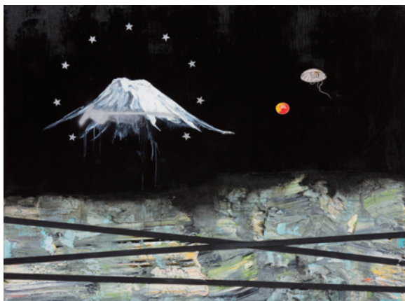
竹崎和征《広重、りんごと富士》2009年 © KAZUYUKI TAKEZAKI