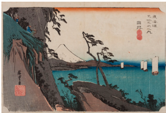
歌川広重「東海道五拾三次之内 由比 藤塚嶽」1833年

荒木経惟 アンドレ・コタボ 池ヶ谷知宏 イケムラレイコ 歌川広重 竹崎和征 奈良美智 野口里佳 松江泰治 水木しげる 棟方志功 持塚三樹 山口晃 ベルナル・ビュフェ